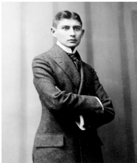
פרנץ קפקא. סצינה מ"הטירה" פותחת את הדו"ח.

ההשפלה היומיומית ב"מעברים" 04:16 | 04.12.2011